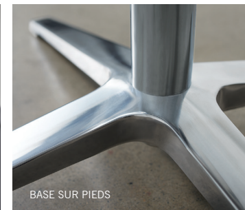
BASE SUR PIEDS