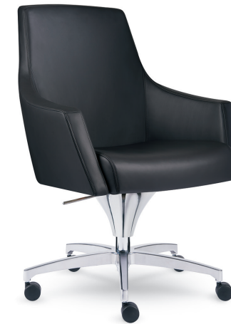
AYLES – MÉCANISME EN CÔNE POUR RÉGLAGE DE LA HAUTEUR – BASE SUR ROULETTES – RECOUVREMENT EN CUIR VOLO NOIR DE SPINNEYBECK.