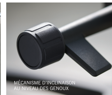
MÉCANISME D'INCLINAISON AU NIVEAU DES GENOUX