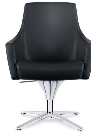
AYLES – MÉCANISME EN CÔNE POUR RÉGLAGE DE LA HAUTEUR – BASE SUR PIEDS – RECOUVREMENT EN CUIR VOLO NOIR DE SPINNEYBECK.

Fabriqué avec un dossier à suspension ergonomique qui épouse la forme du dos de l'utilisateur, Ayles offre un soutien lombaire optimal. Le design fonctionnel du repose-pieds optionnel assure que les utilisateurs se détendent dans la bonne position lorsqu'ils utilisent un ordinateurs portable ou une tablette. Ayles est offert avec une base sur pieds ou sur roulettes et un choix de mécanisme de réglage pour la hauteur en cône ou un mécanisme d'inclinaison au niveau des genoux pour plus de confort et de polyvalence.