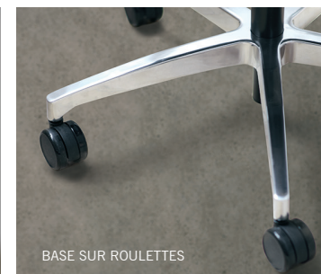
BASE SUR ROULETTES