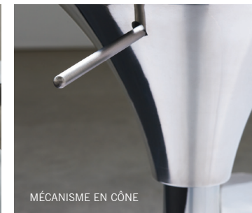
MÉCANISME EN CÔNE