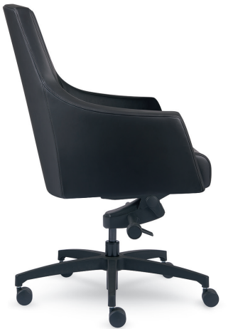
AYLES – MÉCANISME D'INCLINAISON AUX GENOUX – BASE SUR ROULETTES – RECOUVREMENT EN CUIT VOLO NOIR DE SPINNEYBECK