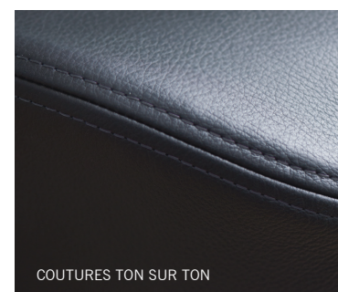
COUTURES TON SUR TON