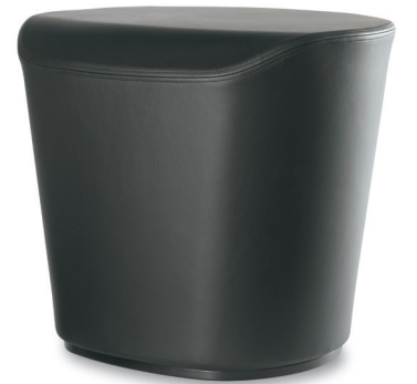
JIF, BASE CONVEXE