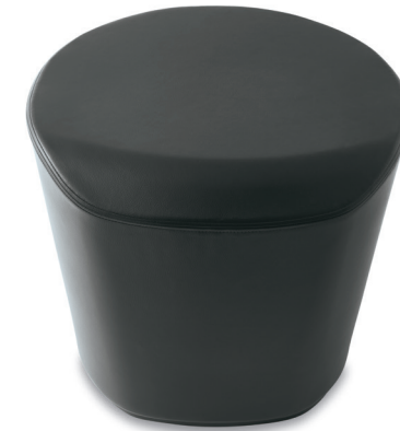
JIF, BASE CONVEXE