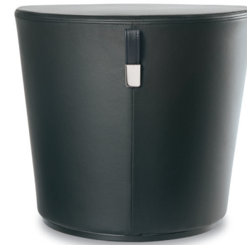
JIF, BASE CONVEXE

Jif est un pouf à l'allure moderne conçu en collaboration avec le designer canadien Aaron Duke. De forme épurée, Jif est muni d'un rebord en biseau qui soulage les ischiojambiers. Jif est offert avec une base plane ou une base légèrement convexe permettant de basculer doucement ou de pivoter. Cela favorise une position assise active qui fait travailler le haut du corps, une composante clé de la philosophie de développement des produits Sit Fit™ d'Allseating.