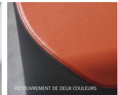
RECOUVREMENT DE DEUX COULEURS