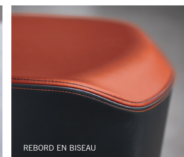
REBORD EN BISEAU